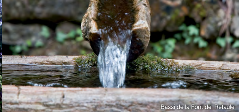
Bassi de la Font del Retaule