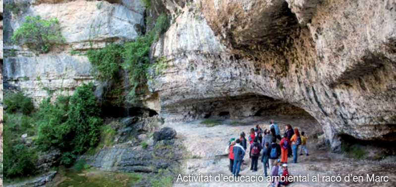
Activitat d'educació ambiental al racó d'en Marc