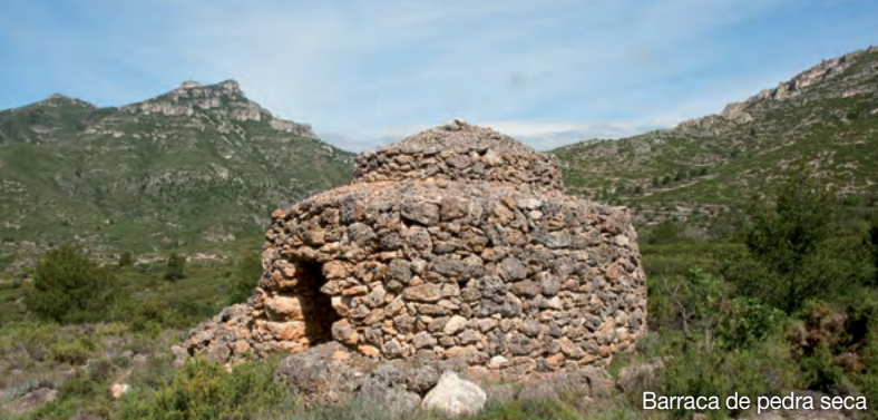
Barraca de pedra seca