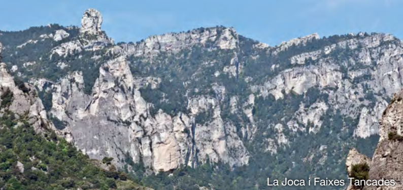
La Joca i Faixes Tancades