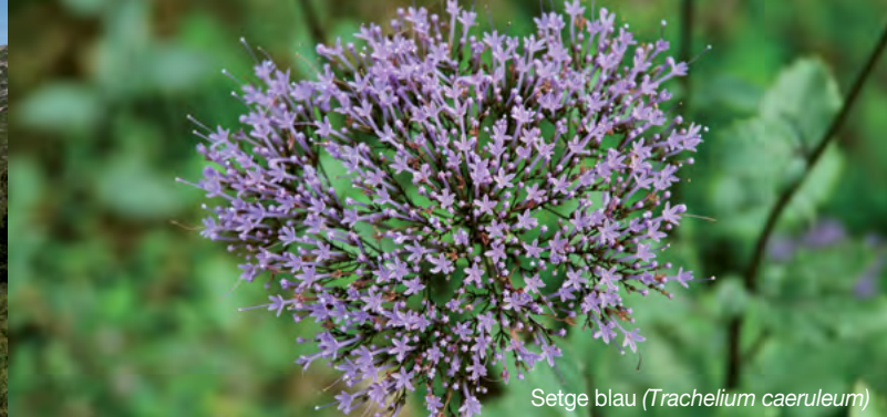
Setge blau ( Trachelium caeruleum )