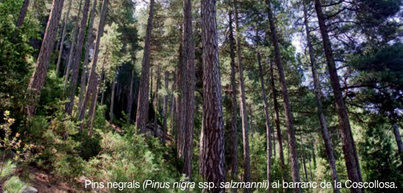
Pins negrals ( Pinus nigra ssp. salzmannii ) al barranc de la Coscollosa.