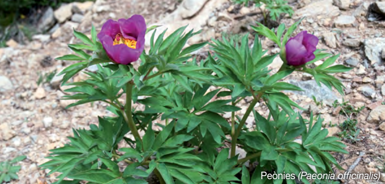
Peònies ( Paeonia officinalis )