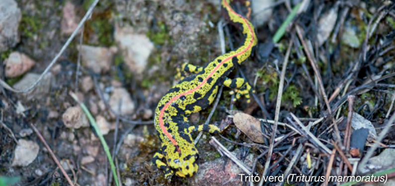
Tritó verd ( Triturus marmoratus )